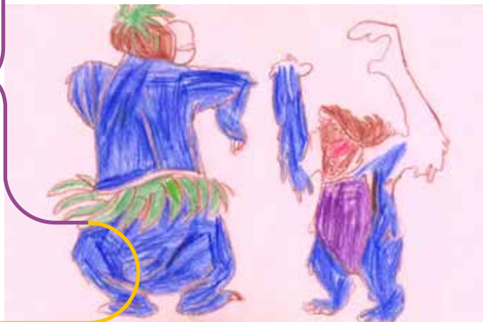
Collection Frac Bretagne © Oliver Beer