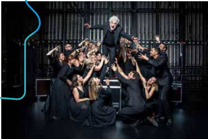
Choeur de chambre Méliisme(s)